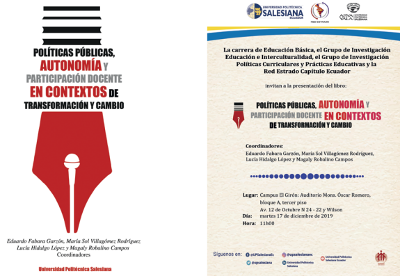
Figura 5. Publicación del tercer libro de la Red Estrado Ecuador: Políticas públicas, autonomía y participación docente en contextos de transformación y cambio

Durante el año 2020 el embate de la pandemia obligó a posponer el V Seminario de la Red, que por tradición se lleva a cabo cada dos años. Sin embargo, ese año fue de fructíferos conversatorios virtuales sobre la educación en tiempos de pandemia. Estas series de conversatorios fueron organizados y convocados por la Red Estrado y las facultades de Educación de la Universidad Politécnica Salesiana, la Universidad Central del Ecuador, la Pontificia Universidad Católica del Ecuador y la Universidad Técnica de Cotopaxi, en colaboración con otras redes de estudio como la Coalición por el Derecho a la Educación, CENAISE, la Red Kipus y la Sociedad Pedagógica del Chimborazo.