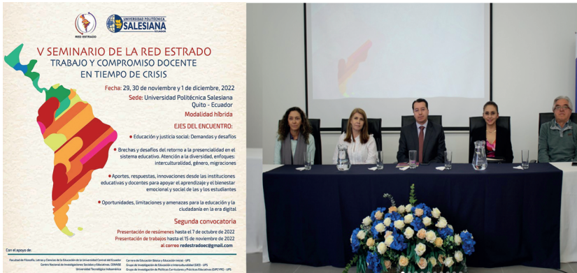
Figura 8. Inauguración del V Seminario de la Red Estrado Ecuador

Finalmente, es necesario reiterar el compromiso constante de la Red Estrado con la profesión docente: como red nacional hemos participado de manera continua desde 2012 con una delegación permanente en los seminarios y proyectos continentales de Estrado América Latina.