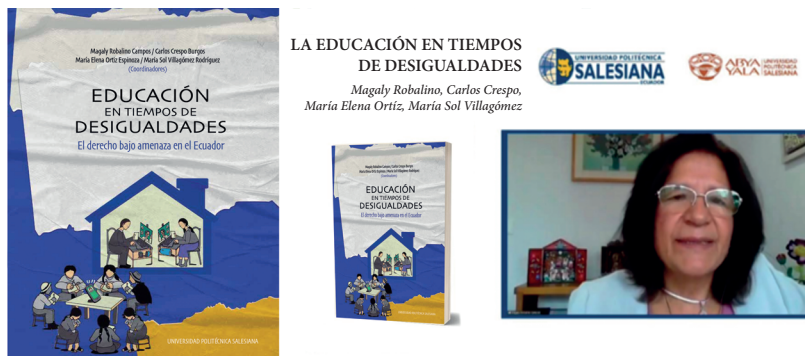
Figura 7. Publicación de la obra colectiva: Educación en tiempos de desigualdades, bajo la coordinación de Magaly Robalino Campos