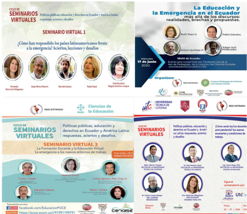
Figura 6. Seminarios virtuales de la Red Estrado Ecuador en la época de pandemia