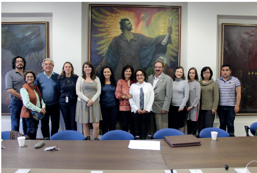
Figura 4. Especialistas internacionales participantes en el IV Seminario internacional de la Red Estrado Ecuador