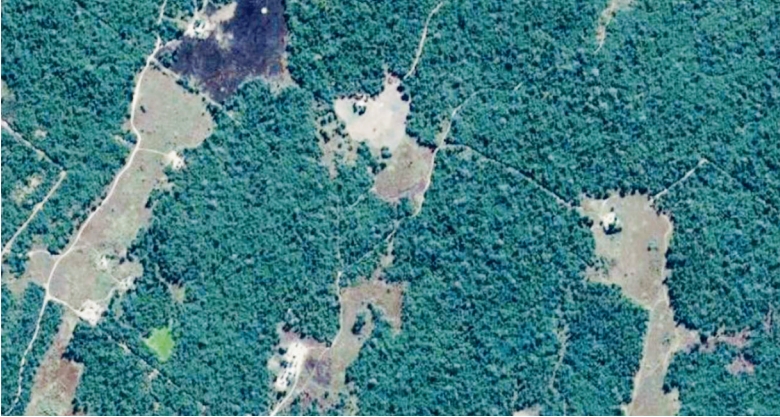
Imagen ampliada de zona B2