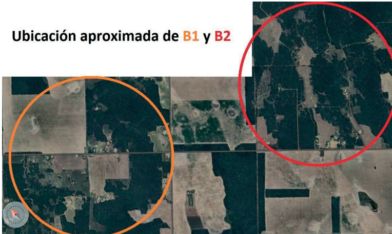
Figura 3 Mapa satelital de Las Tolderías