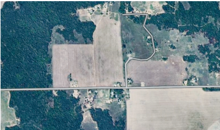
Figura 4 Imagen ampliada de zona B1