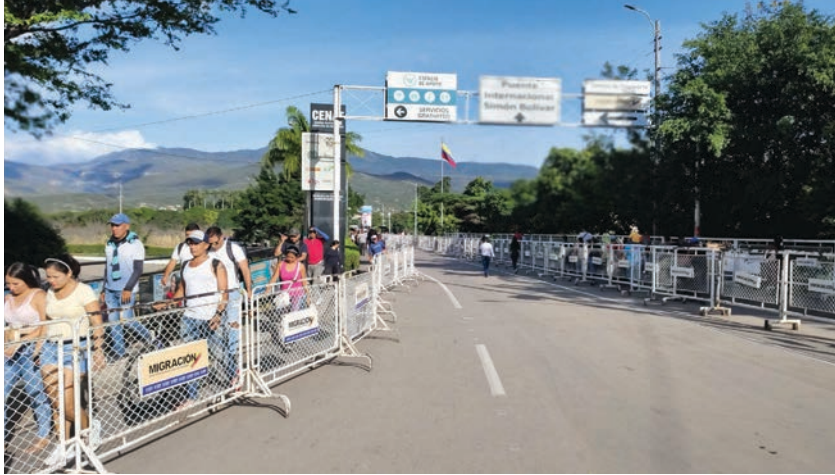
Figura 8 Gestor de migración en Cruz Roja colombiana, 2022