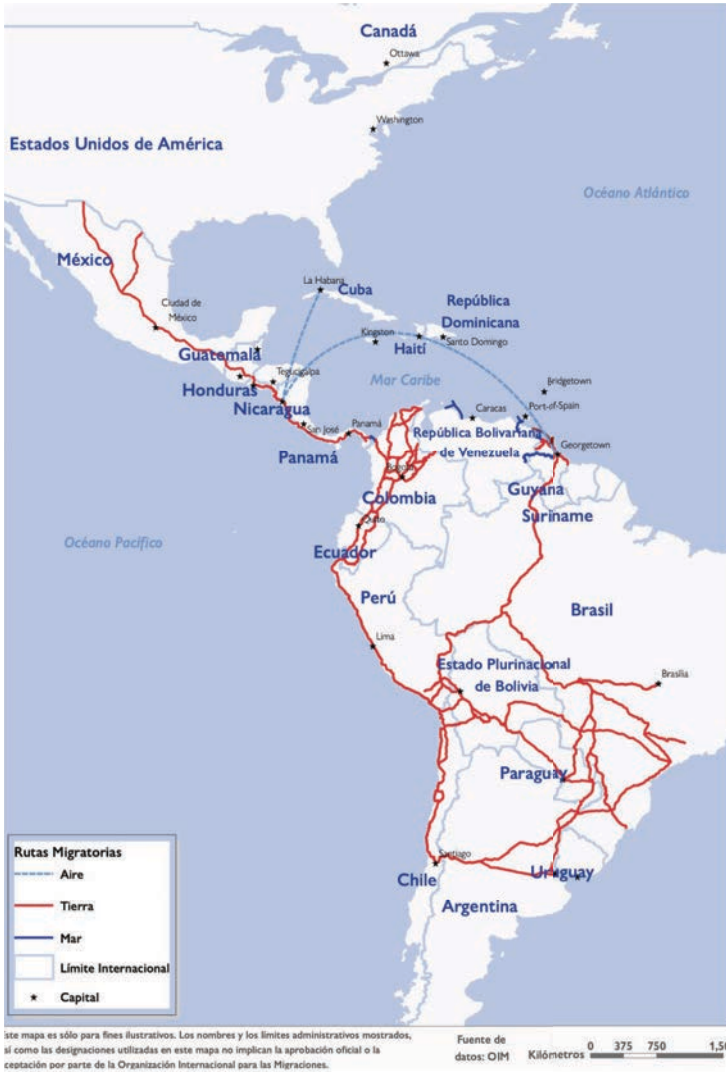
Figura 3 Tendencias migratorias en las Américas 2023