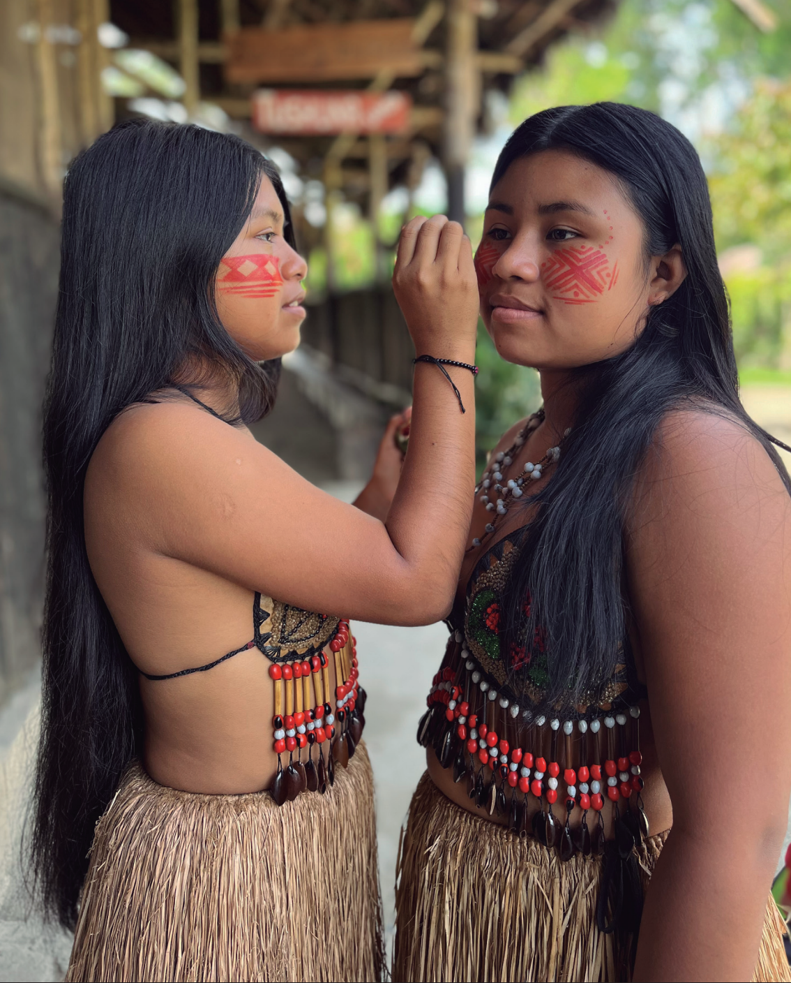
Comunidad Kotokocha Kichwa Napo, Ecuador